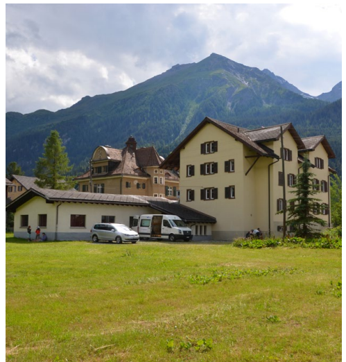
Unser Lagerhaus in Rona GR

Die Energie der Nacht wollte dann aber auch mal raus und wir spielten bei ganz leichtem Regen Baseball. Zuerst schön üben mit abschlagen und fangen, bald aber auch schon eine erste Runde spielen. Nach dem Zmittag kam ein aufgelöster Gärtner in den Esssaal