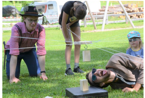
Das Stapeln der Blöcke ist Präzisionsarbeit!