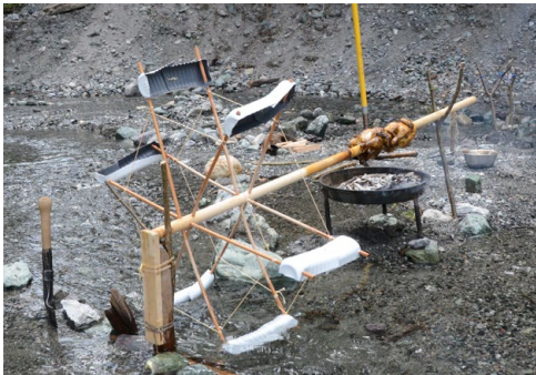
Eines der drei Poulet-Wasserräder