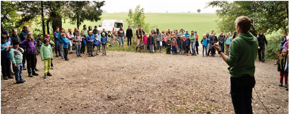
Der gemeinsame Start mit 70 Kindern und 50 Leitern.

Schlussendlich konnten alle Tiere und Grundstücke verkauft werden und der Erlös wurde der entsprechenden Jungschar gutgeschrieben. Doch bevor auskam, welche Gruppe den Wettbewerb gewann, stärkte man sich mit einem Zvieri. Obschon neun verschiedene Jungscharen beteiligt waren,