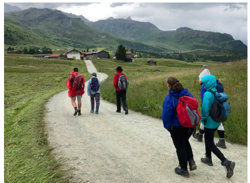
Die Wanderung führte über die Alp Flix.

Richtung Alp Flix. Die ersten Kilometer waren von vielen Höhenmetern geprägt, doch wurden wir vom Hochmoor und der schönen Natur belohnt! Zuhinterst in einer Bärenhöhle fanden wir tatsächlich unseren geliebten nichtssagenden Gartenzwerg. Zufrieden konnten wir uns auf den Rückweg machen. Nach 24 Leistungskilometern- für den Bauern sogar noch mit einem Schwumm im Bergbach,- kamen wir alle glücklich und kaputt wieder in Rona an. Um diesen erfolgreichen Tag nach einem feinen Znacht noch abzurunden, spielten wir Lotto.